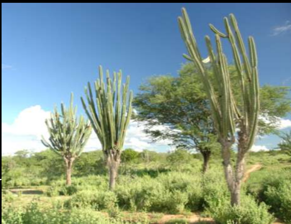
Cactaceae Pilosocereus gounellei Xique-xique