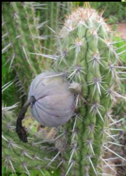
Cactaceae Pilosocereus gounellei Xique-xique